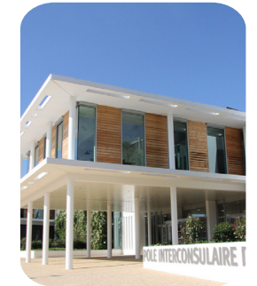
Le siège à Coulounieix

AGRICULTURES & TERRITOIRES CHAMBRE D'AGRICULTURE DORDOGNE