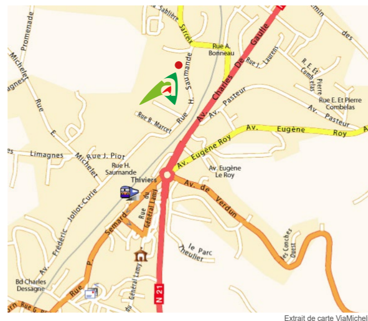
Plan d'accès de l'antenne Périgord Vert à Thiviers

> Ouverture au public 9 h - 12 h // 13 h 30 - 17 h du lundi au vendredi