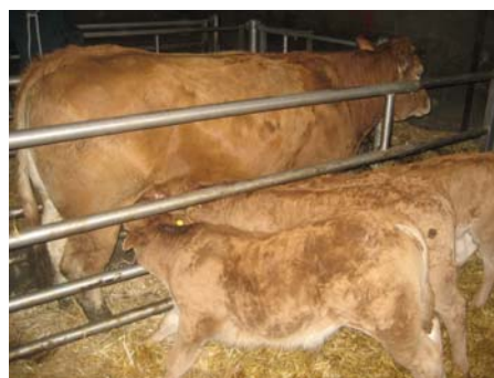
Téte en libre service

Autant il est concevable d'aménager sommairement quelques cases collectives pour une production ponctuelle, autant une production conséquente et pérennisée nécessitera des aménagements plus rationnels en termes de confort et de temps de travail. Des publications décrivant des bâtiments innovants sont disponibles.