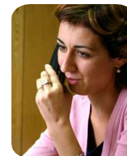
Toutes les lignes directes