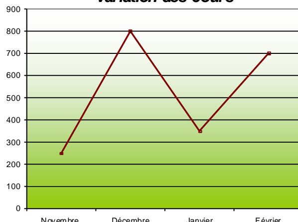
Variation des cours

Ce type de marché n'existe pas en Dordogne.