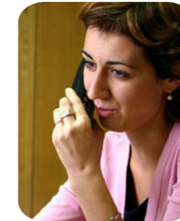
Toutes les lignes directes