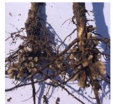
Nodosités abondantes sur les racines de pois chiche

Les deux maladies les plus fréquemment rencontrées sur pois chiche sont l'ascochytose (nouveau nom de l'antracnose dans la classification) et la fusariose, qui se manifestent aux stades préfloraison/floraison. Les leviers à mettre en place pour limiter ces maladies sont le respect du délai de retour du pois chiche sur une parcelle, l'utilisation de semences saines, de bonnes conditions de semis (et l'enfouissement des résidus si présence avérée de fusariose).