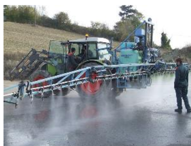
Contrôle de rampe de pulvérisateur