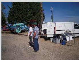
Banc de contrôle mobile de pulvérisateur