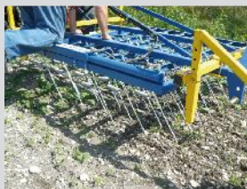
Herse étrille : alternative au désherbage chimique