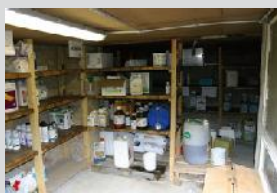
Local produits phytosanitaires