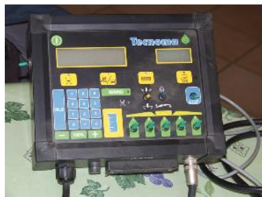
Boîtier de contrôle de barre de guidage