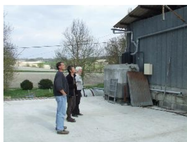
Aire de lavage pour pulvérisateur