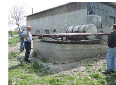
Traitement des effluents de produits phytosanitaires

Chambre d'agriculture Antenne de Ribérac Angélique ROY Référénte départe- mental Certiphyto Tél. 05 53 92 47 50