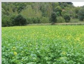
Couverts végétaux : pièges à nitrates