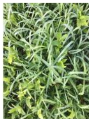
Moha *Cow Pea