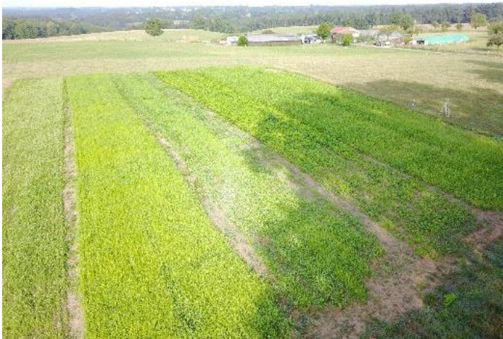
Vue aérienne de l'essai au 12 août, les 6 bandes sont visibles (de gauche à droite : trèfles, moha, moha*cow pea, cow pea, sorgho*cow pea, sorgho)

https://www.youtube.com/channel/UCPaivCvZnqr66uEs_k0t_UQ (vidéo réalisée par Laurence Vigier CDA24)