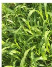
Sorgho *Cow Pea