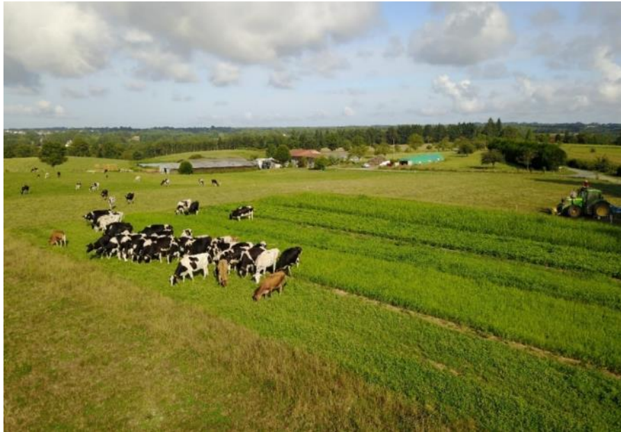
Les vaches à leur arrivée sur l'essai, 1 ère pâture, 12 août 2019

Essai réalisé à Saint Saud Lacoussière (24) chez M. Garat (éleveur 50 vaches laitières bio)