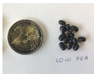
Graines de cow pea

Le cow pea (variété Black Stalion) et le lablab sont des nouvelles légumineuses fourragères estivales commercialisées pour la première fois en France par Semental en 2018. Le cow pea se sème sur sol réchauffé (12°C) à partir de la mi-mai (préférer même les semis après fin mai) et semble adapté à une large gamme de types de sol sauf aux sols très argileux et humides/mal drainés. Il possède un PMG de 66g, s'apparente à un soja et mesure au maximum 1mètre de hauteur. Quand il est associé au sorgho (valorisation attendue en ensilage) il peut envoyer tardivement quelques tiges s'accrocher sur celles du sorgho. Le cow pea comme le lablab ne fleurissent pas dans le département, et ne produisent donc pas de graines.