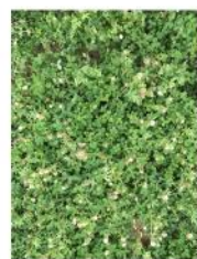
Trèfles Alexandrie Akeneton Flèche Viper