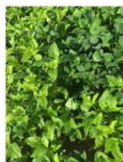
Cow Pea Black Stalion