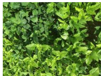
Cow pea, variété Black Stalion