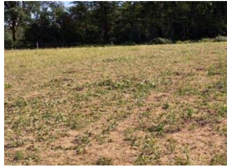
Cow pea après 1 ère pâture au 13/08

La seconde pâture a eu lieu le jeudi 12 septembre pendant la visite de l'essai. Seulement 18 mm étaient tombés depuis le 12 août, les couverts avaient tous repoussés mais étaient peu développés. Les hauteurs d'herbe moyennes étaient de 11 cm pour le sorgho, 13 cm pour le cow pea, 16 cm pour le moha et 3 cm pour les trèfles. Nous avons observé les vaches à la pâture et leur comportement différait de celui du 12 août. Elles ont navigué entre les différentes bandes et ont cette fois mangé le cow pea rapidement comme les autres espèces.