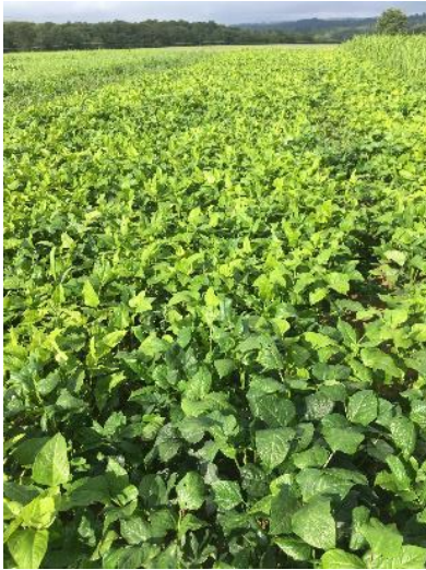
Cow pea avant 1 ère pâture au 12/08

Le 12 août au soir, toutes les bandes étaient rasées, sauf celle de cow pea. Les vaches ont eu accès à l'essai la nuit, et le lendemain matin le cow pea était consommé dans son intégralité !