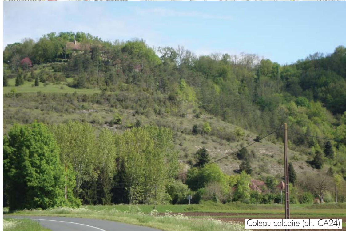
Coteau calcaire