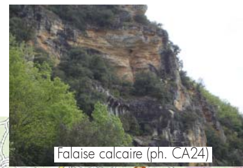
Falaise calcaire (ph. CA24)