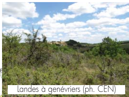
Landes à genévriers