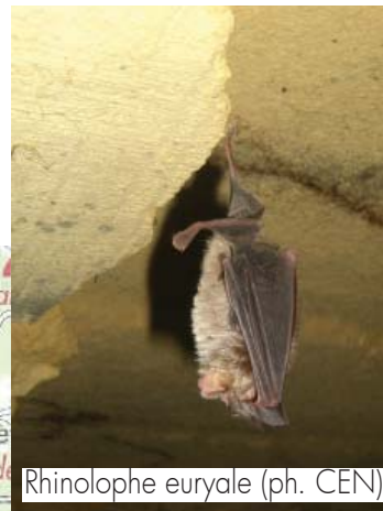
Rhinolophe euryale