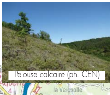
Pelouse calcaire