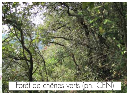
Forêt de chênes verts