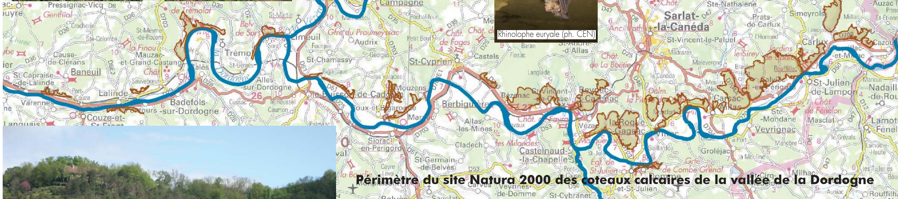
Périmètre du site Natura 2000 des coteaux calcaires de la vallée de la Dordogne